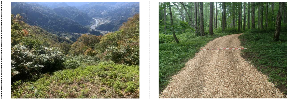
【セラピーロード沿線で景観を阻害している支障木を伐採しました。】