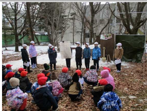
【学校林を活用して森林整備や森林体験を行いました。】