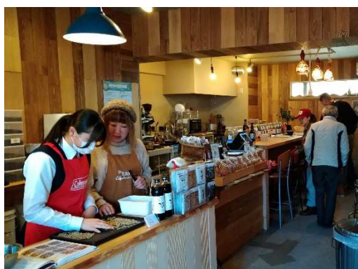
HAKUBA COFFEE STAND