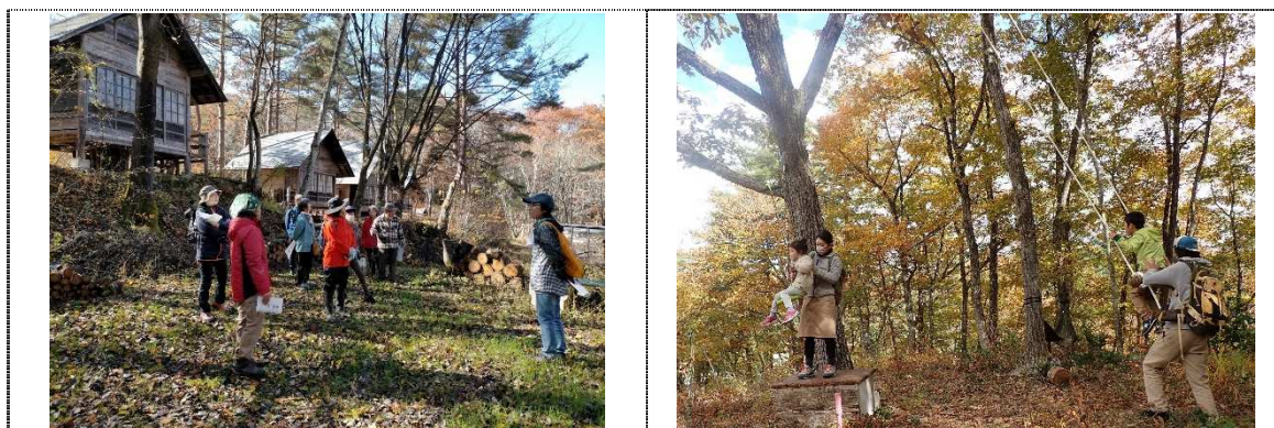
【里山整備利用地域で地元住民や小学生が参加して講習会や森林体験会が実施されました。】