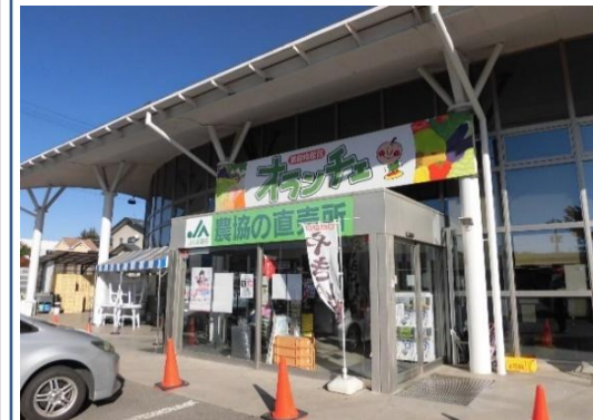
JA中野市農産物産館 オランジェ(信州中野I.C.前)

信州中野I.C.前や国道292号沿いにあるJAの直売場は、季節の果物や野菜が手頃な価格で販売され、観光客にも人気が高い。