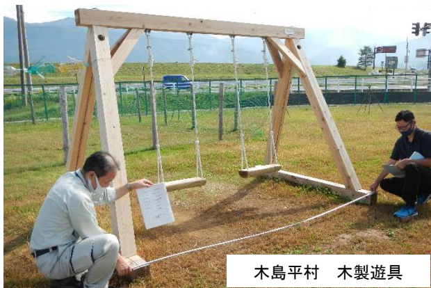
木島平村 木製遊具