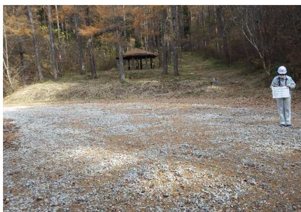
中野市高社山四区 活動集合同所整備