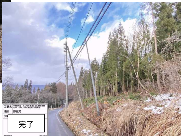
栄村 積雪により架線に被害を与える可能性がある危険木の伐採