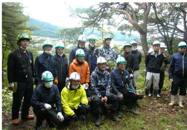
山ノ内町湯田中 伐採作業集合写真