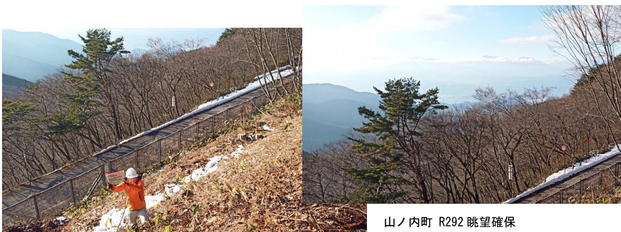
山ノ内町 R292 眺望確保