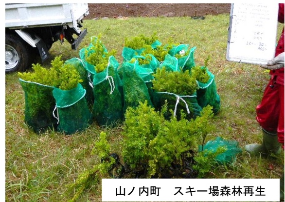
山ノ内町 スキー場森林再生