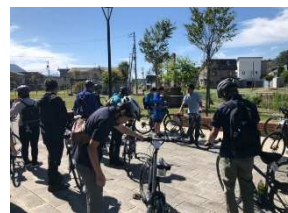
R5.9.25開催の長野・北信サイクルツーリズム推進会議の様子