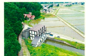
【湛水被害から農村を守る木島第一排水機場】