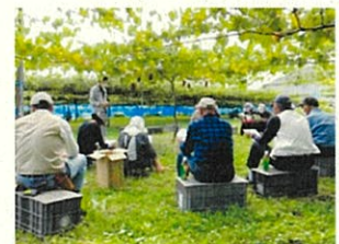
【クイーンルージュ®の栽培検討会】