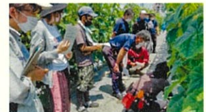
【北信州農業道場：先進農家に学ぶ】