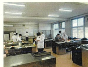
【高校生による伝統野菜のレシピ開発】