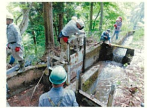
【地域ぐるみの水路保全活動】