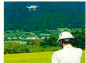
【農業用ドローンによるリモートセンシング】