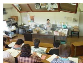
【旅館「女将の会」への食材提案会】