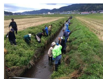
【地域ぐるみでの水路の保全管理】