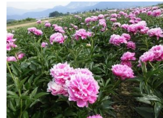
【シャクヤク栽培(飯山市)】