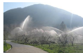
【スプリンクラーによる樹園地かんがい】