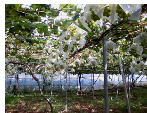
【シャインマスカット栽培(中野市)】