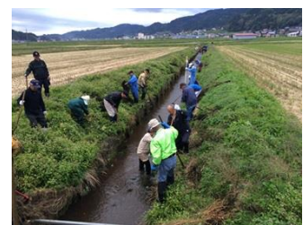
【地域ぐるみでの水路の保全管理】