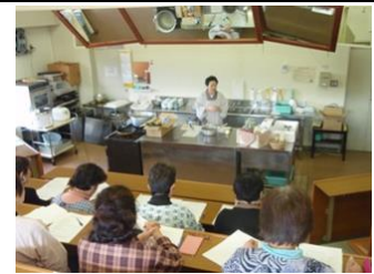
【旅館「女将の会」への食材提案会】