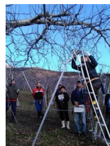
【北信州農業道場りんごコース】