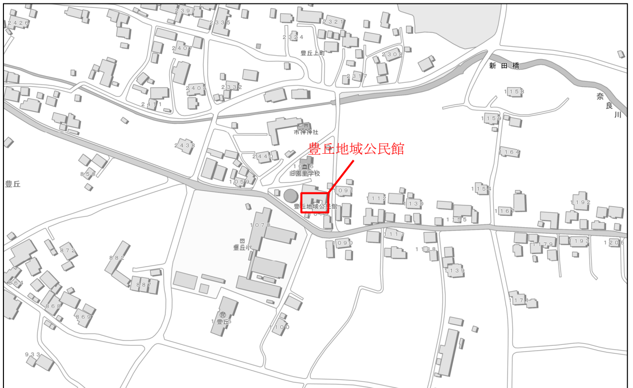
説明会会場周辺 拡大図