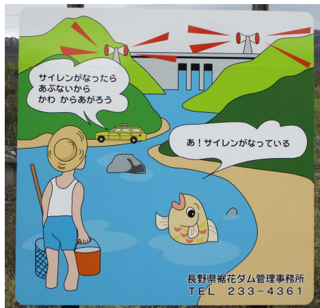
周知立札（絵図）の一例