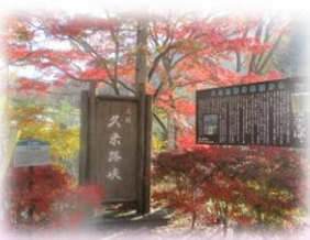
久米路峡(長野市)紅葉 平成30年11月