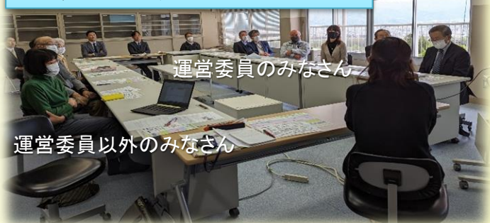
運営委員以外のみなさん

運営委員ではないのですが、実際に授業などで子どもたちと関わる機会が多い方に運営委員会に参加をしてもらいました。