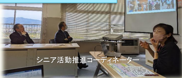
シニア活動推進コーディネーター

県内のシニア世代の学校とのかかわりについて事例を紹介し、具体的なイメージを参加者全員で共有しました。