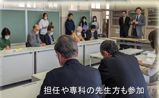
担任や専科の先生方も参加