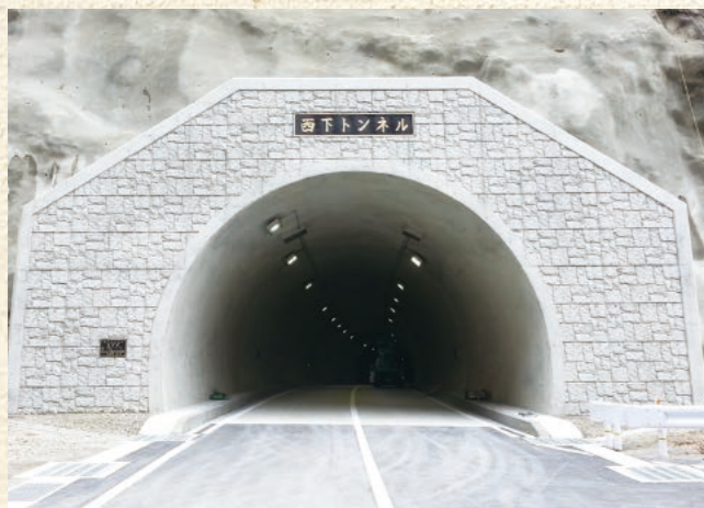
西下トンネル松川側入口