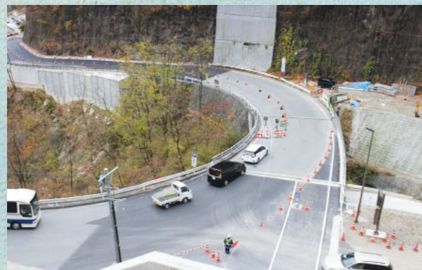
■ 入り口付近 松川側