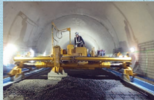
■ コンクリート舗装打設状況