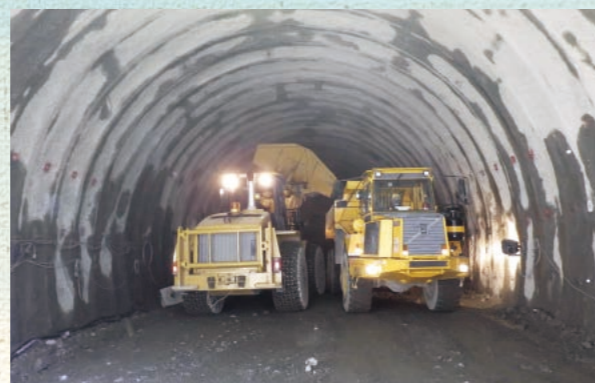
■ ずり (掘削土) 出し