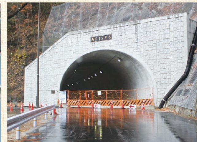
西下トンネル大鹿側入口