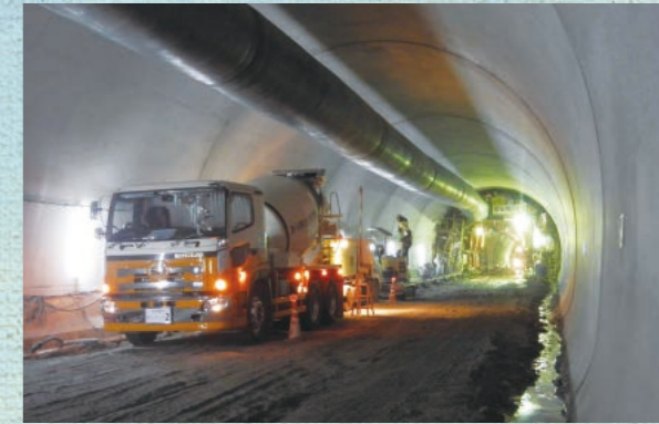
■ コンクリート打設