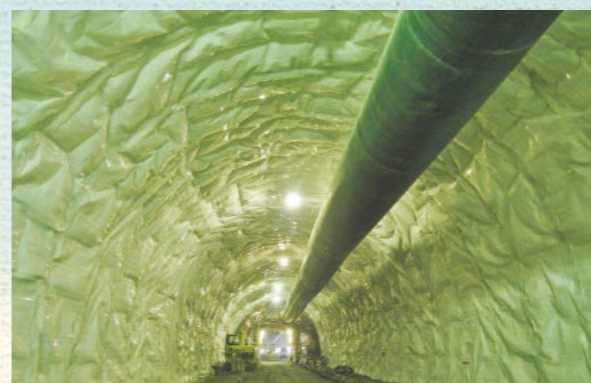
■ 防水シート防水張施工状況