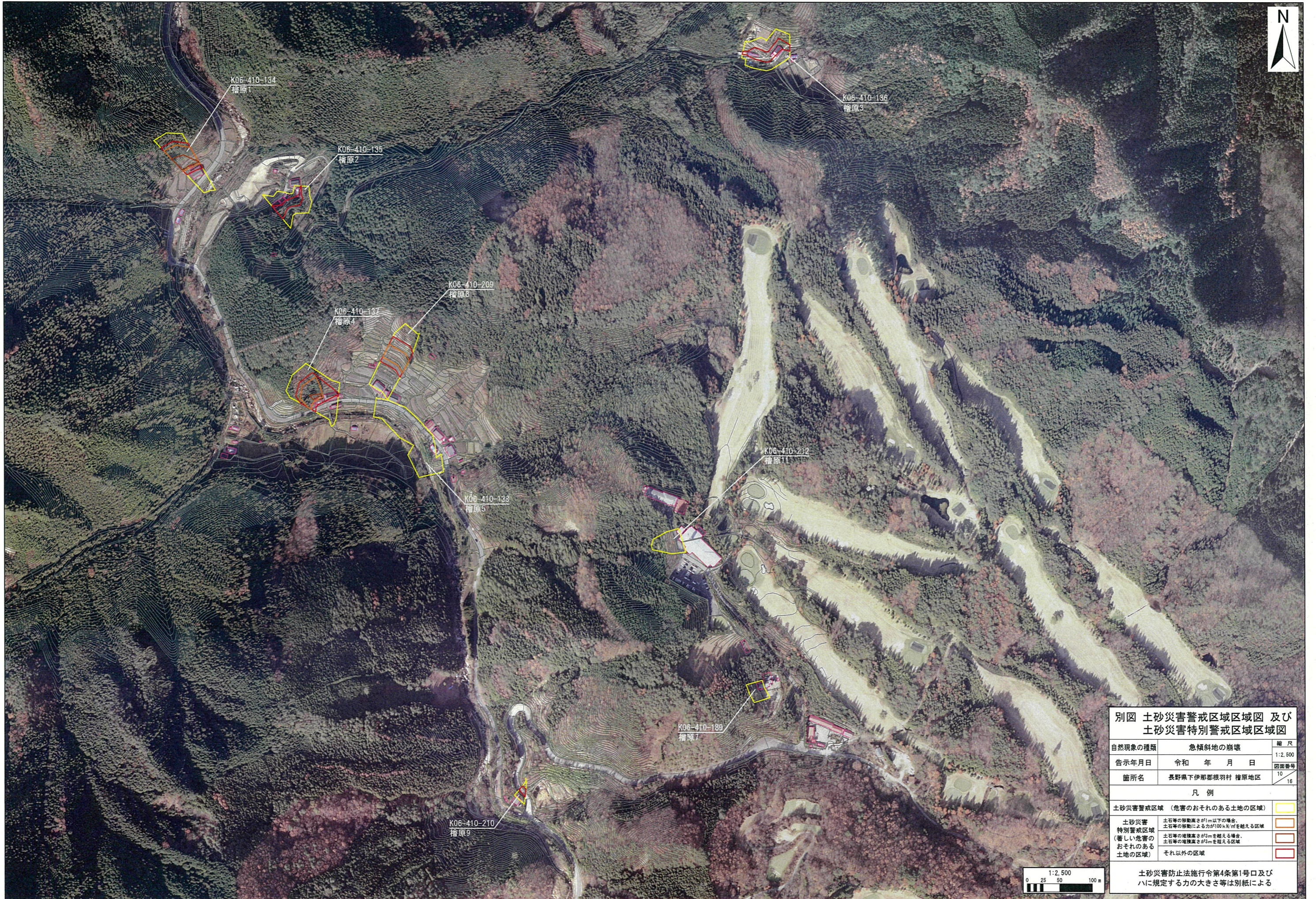
別図 土砂災害警戒区域区域図 及び 土砂災害特別警戒区域区域図