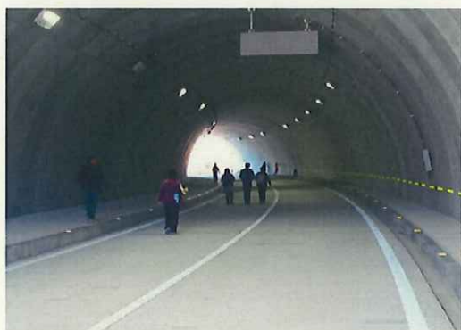
日方磐トンネルの中をウォーキング