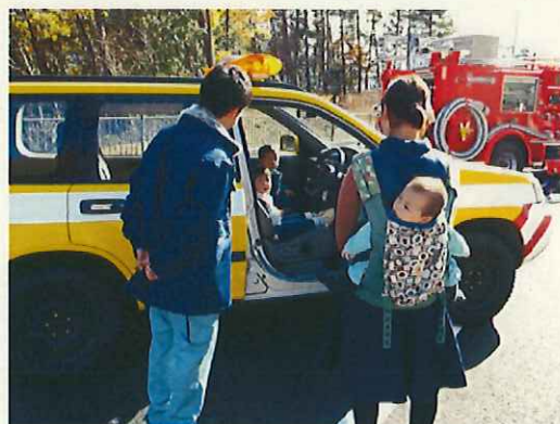
道路パトロール車に試乗