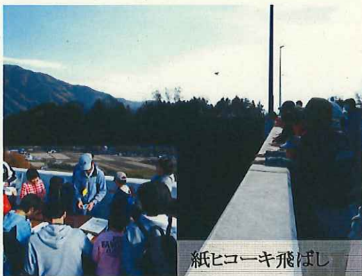
紙ヒコーキ飛ばし

未開通区間を歩く「いいちゃんウォーク」や、新郷沢橋上での「紙ヒコーキ飛ばし」や「路面にお絵かき」、消防車など「働く車の展示コーナー」などのイベントがおこなわれました。