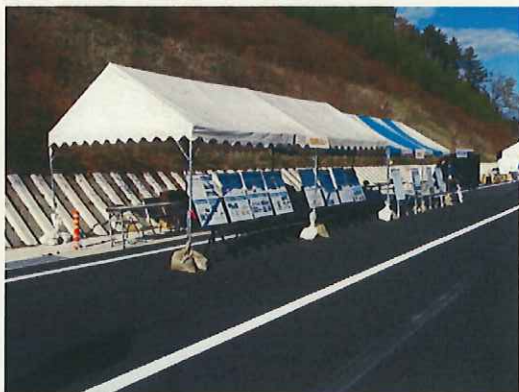
パネル展示で国と県の道路を紹介

伊那建設事務所では、新しく開通する伊那生田飯田線「田切バイパス」を紹介する「パネル展示」と、道路パトロール車の展示を行いました。