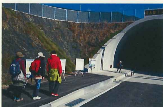
トンネル入り口でパネル展示も行いました