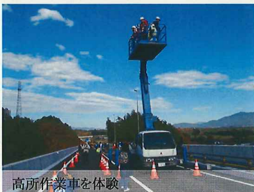
高所作業車を体験