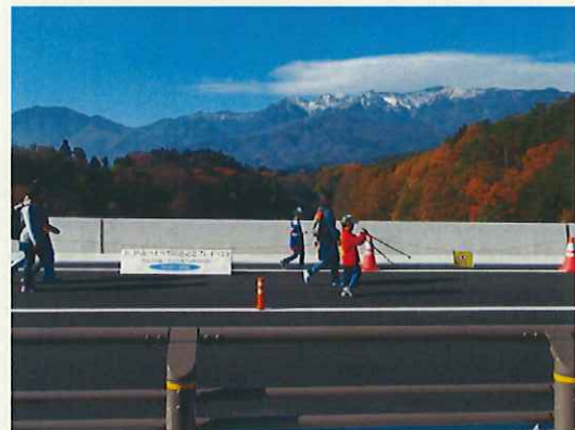
快晴の中央アルプス(新郷沢橋から)

未開通区間を歩く「いいちゃんウォーク」や、新郷沢橋上での「紙ヒコーキ飛ばし」や「路面にお絵かき」、消防車など「働く車の展示コーナー」などのイベントがおこなわれました。