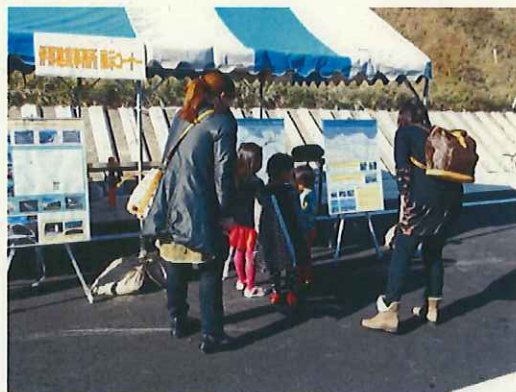
ご覧いただいています