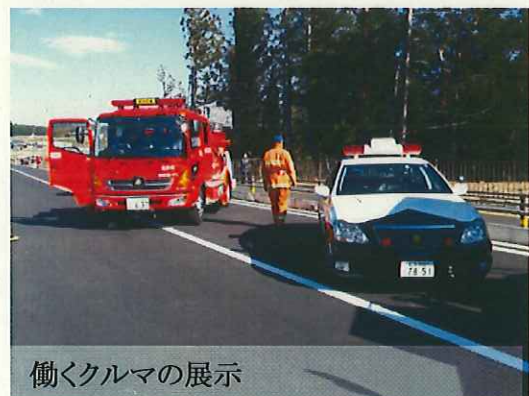
働くクルマの展示