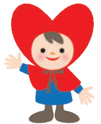
長野県人権啓発キャラクター 「こころちゃん」

事件や事故には至っていなくても、犯罪の未然防止など相談したいことがあるときは ご利用下さい。