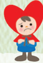
長野県人権啓発キャラクター 「こころちゃん」