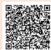
<ホームページQRコード>

https://www.pref.nagano.lg.jp/jinken-danjo/kurashi/jinkendanjo/danjo/main/leader.html