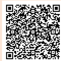
<ホームページQRコード>

https://www.pref.nagano.lg.jp/jinken-danjo/kurashi/jinkendanjo/danjo/main/leader.html