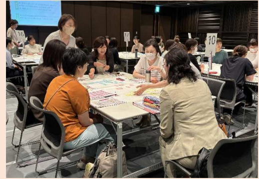
<はたらく女性の異業種交流会>