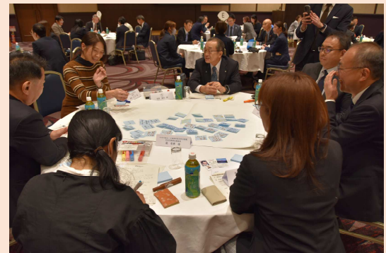
<第4回リーダーミーティング>