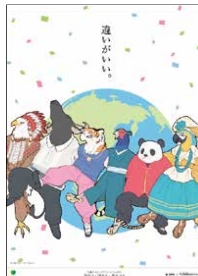
「違いがいい。」同じ地球に生きる仲間です。一人ひとりの違いが楽しさを生みます。 〔長野美術専門学校生作品〕 人権ポスターデザインプロジェクト