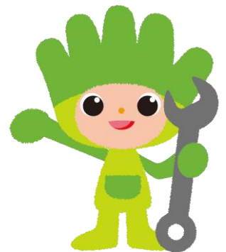
長野県ものづくり人材育成 応援キャラクター わざまる