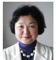
長野県副知事： 加藤さゆり