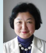
長野県副知事 加藤さゆり (かとう・さゆり)

長野県上田市出身。優香・泉ピン子・ベッキー・上野樹里などのモノマネが人気。FM長野『echoes』（水曜 16時～）メインパーソナリティ。