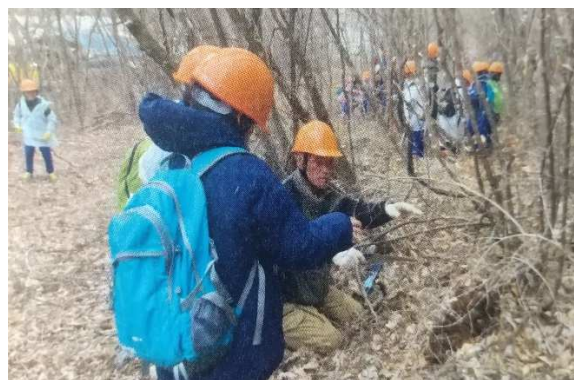
遊歩道・景観整備