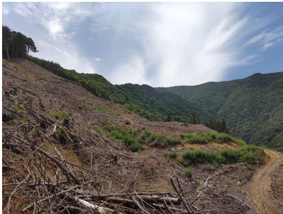
人工造林（植栽）@青木村長峯 信州上小森林組合施工