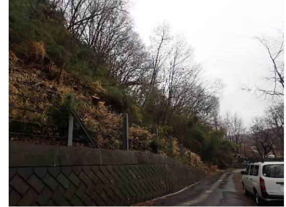
観光地等の景観整備（青木村 横手キャンプ場）