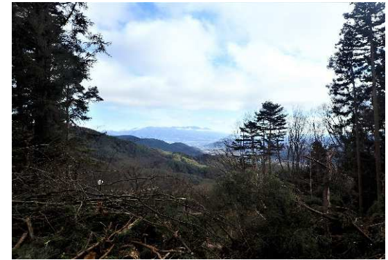
ライフライン等の保全整備（長和町 古町）