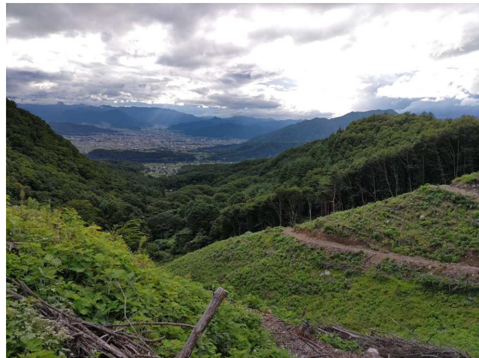
下刈 @上田市岩戸 信州上小森林組合施工