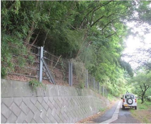
ライフライン等の保全整備（東御市 西海野）