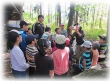
森林環境教育・自然保育