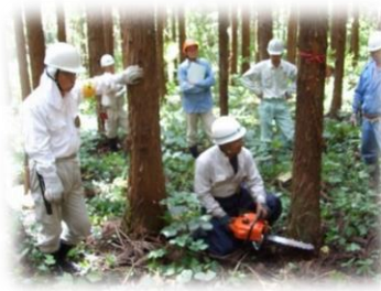
地域主体の里山整備