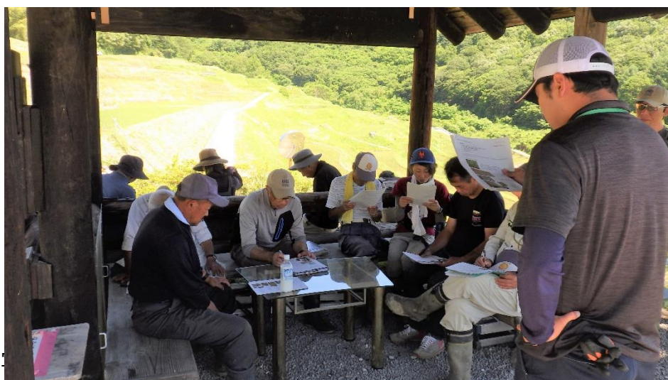
稲倉の棚田あずまやで勉強会

今年度は昨年度と同等の収量・品質を確保できるか確認をするとともに、保全委員会で栽培を中心に担っている皆さんが、安定生産のための技術を理解し、作業できるよう、勉強会を開催しています。6月19日には除草など、7月5日には追肥について勉強していただきました。多くの質問や意見が出され、保全委員の方々の熱意を感じる勉強会となりました。