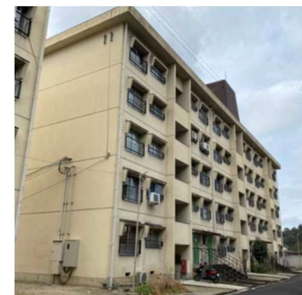
京都市「醍醐中山団地」 (S50年度建設) 外観