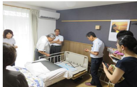
外部からの見学受入