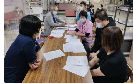
プロジェクトチーム会議の様子