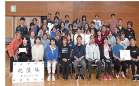
スマイルジョブプロジェクト