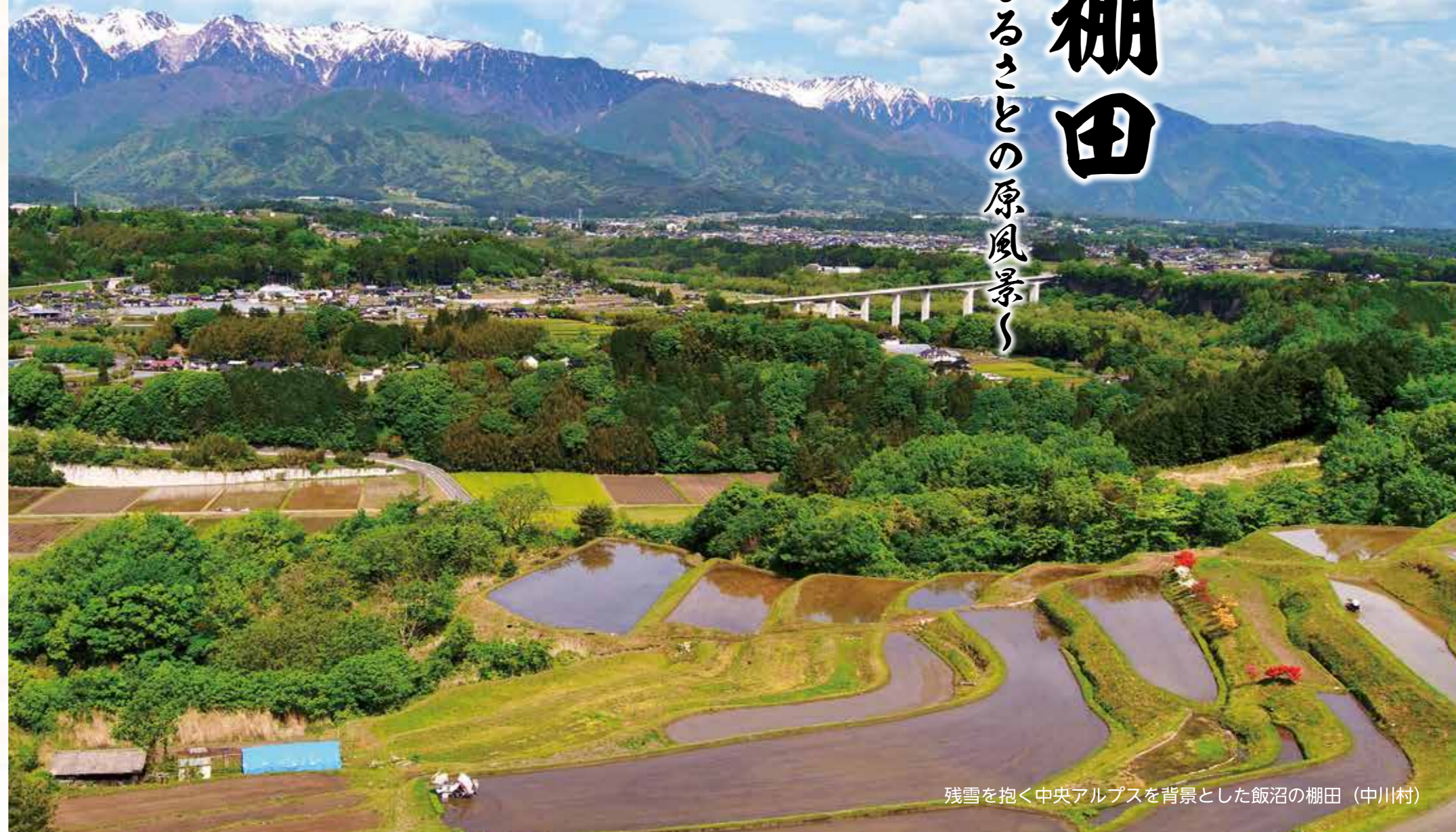
残雪を抱く中央アルプスを背景とした飯沼の棚田（中川村）