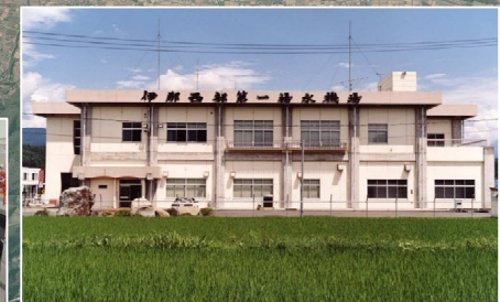
伊那西部第1揚水機場