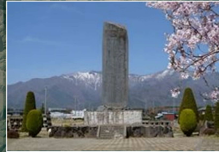
西天竜開田記念碑