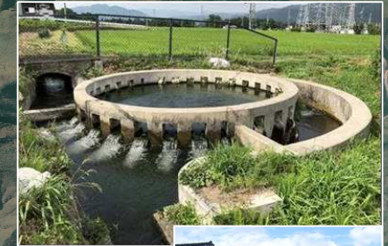
西天竜 円筒分水工