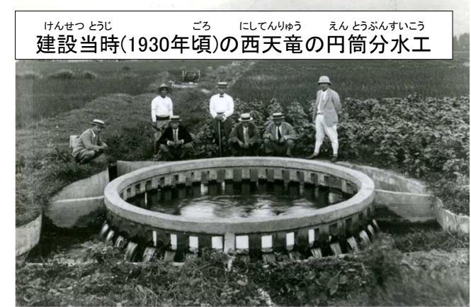
(箕輪町郷土博物館所蔵写真)