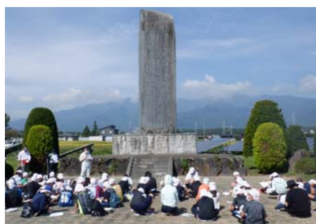
【西天竜幹線用水路の開田記念碑】