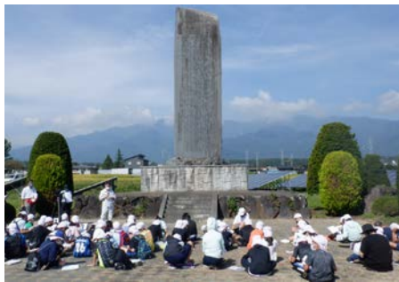
【西天竜幹線用水路の開田記念碑】