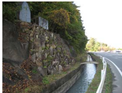
【三峰川左岸を流れる伝兵衛井筋】