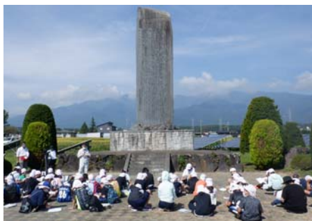
【西天竜幹線用水路の開田記念碑】