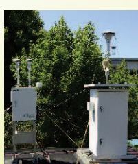
環境保全研究所局におけるPM2.5調査の様子