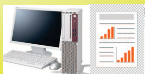
データ解析のイメージ図