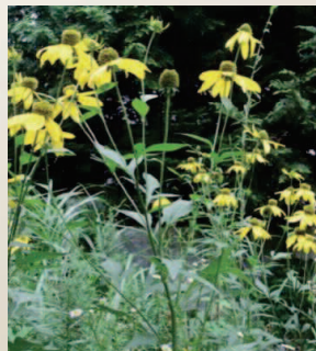
根羽村の高原に咲き乱れるオオハンゴンソウ