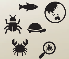
分布を広げる生物たち

<目標> 早期発見手法（環境DNA技術等）の適用可能性を探ります。また、優先度の高い外来生物への効果的な対策を検討し、普及をはかります。