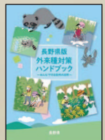
長野県版外来種対策ハンドブック