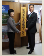
信州気候変動適応センターを設置（2019年4月1日）

<現状と課題> 長野県は2019年4月1日に気候変動適応を推進する情報発信の拠点として「信州気候変動適応センター」を設置しました。しかし、信州の気候がどのように変動していくのかについて、情報の整備がまだ不十分であることや、今後適応策を実施するために必要な情報の把握・発信がまだ十分できていないことが課題となっています。