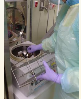
(検体の遠心分離作業)