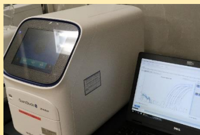
(リアルタイムPCR検査機器)