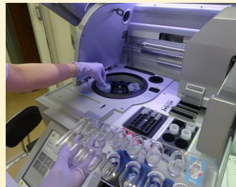
(機器による核酸抽出作業)