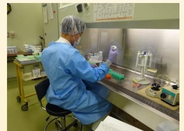
(試薬との混和作業)