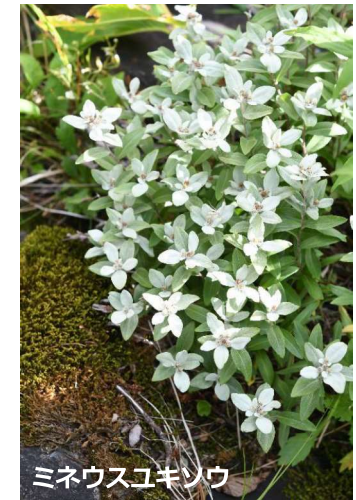
ミネウスユキソウ