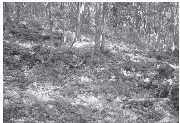
生き物の豊かな二次林

いうことを意味しています。しかし、地球温暖化防止と生物多様性保全のための対策がすべて共通というわけではなく、中には相反する対策もあります。たとえば、地球温暖化対策として二酸化炭素の吸収源を確保するため、成長の早い単一樹種だけを植林したり、木質バイオマスを供給するために強度の伐採を行ったりすることなどです。こうした対策は二酸化炭素の削減にとっては効果的であるにしても生物多様性の保全の観点からは決して好ましくありません。ある樹木だけに炭素を吸収させるのではなく、森林の生態系全体として炭素の吸収力を高めたり、間伐の場所やタイミングを生物に配慮しながら計画的に実施するというスタンスが重要です。