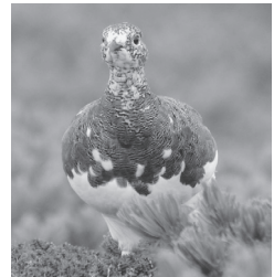
本州中部の高山帯のみに生息するライチョウ

地球温暖化の現状と将来予測 / 地球温暖化と信州の高山植物 / 伊那谷における蝶類の動向 / 暖地性植物の分布拡大 / 温暖化とライチョウ / 気候変動適応社会に向けて