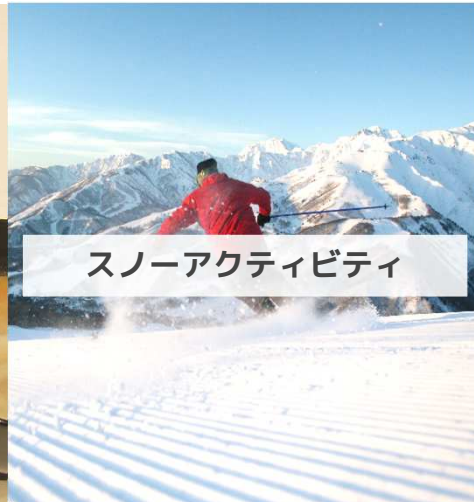
スノーアクティビティ