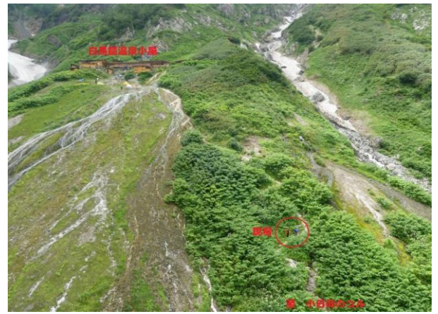
⑥ 白馬鎌ヶ岳 遭難現場