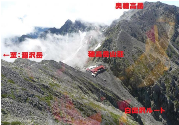
⑦ 奥穂高岳 遭難現場