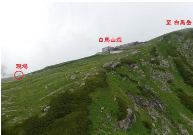
③ 7/23 白馬岳 遭難現場