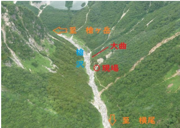
① 7/22 槍ヶ岳 遭難現場