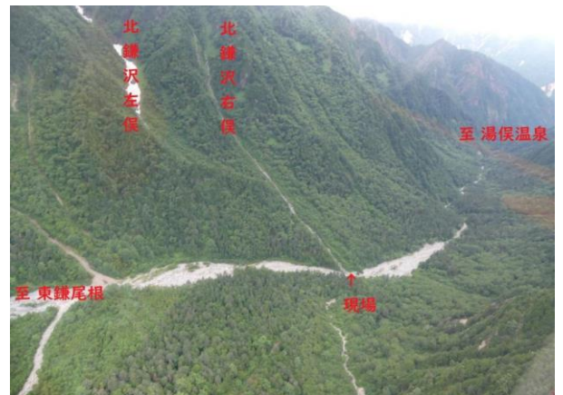
④ 7/23 槍ヶ岳北鎌尾根 遭難現場