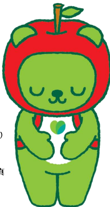
長野県PRキャラクター「アルクマ」