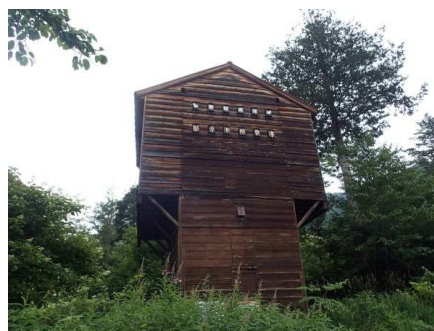
写真-2 乗鞍高原のバットハウス

クビワコウモリを守る会は1995年（平成7年）に発足した。1996年（平成8年）には、民間企業からの助成金を活用し、乗鞍自然保護センターの隣接地にバットハウス※（写真-2）を建設し、繁殖場所の確保を図った。