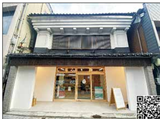
くらしふと信州（長野市）

阿部知事のほか、カナダの元環境・気候変動大臣や、投資会社の気候金融部門責任者など3人が登壇しました。アーカイブがありますのでご覧ください。（英語のみ）