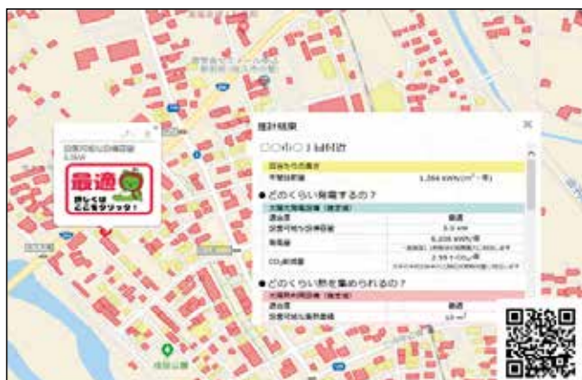
信州屋根ソーラーポテンシャルマップ