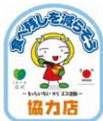
協力店ステッカー

また、予約の時は、参加者の人数や好みをチェックし、食品ロス削減に取り組む「食べ残しを減らそう県民運動～e-プロジェクト～」協力店(e-プロ協力店)をご活用ください。