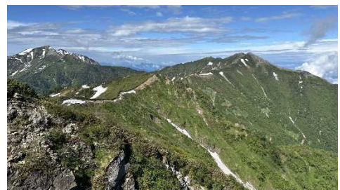
ライチョウ調査を行っている爺ヶ岳