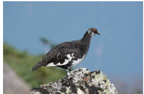
高山帯のシンボル ライチョウ