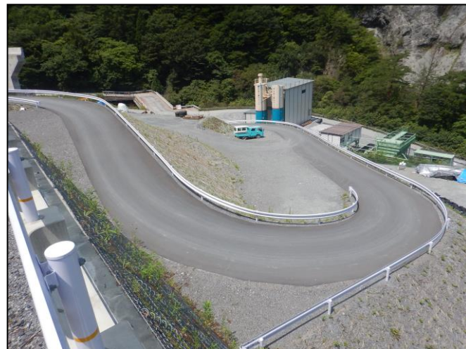
工所用道路の仮舗装