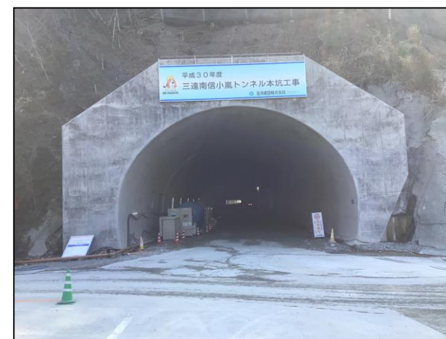
②トンネル本坑坑口