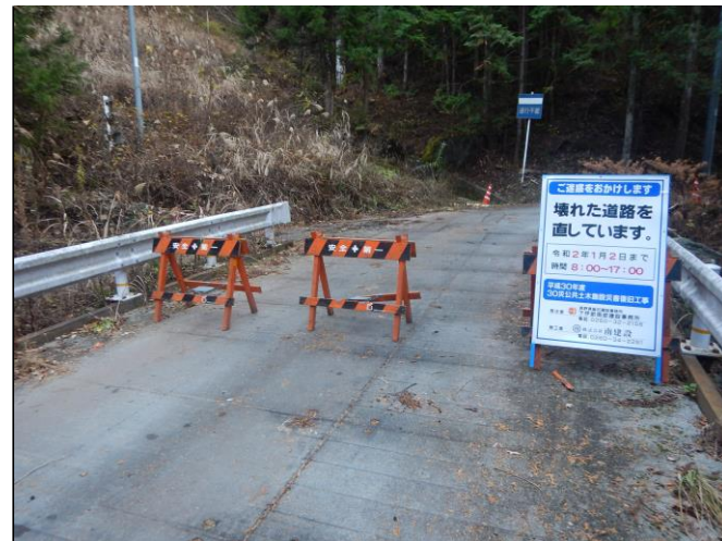
工事現場への立ち入り禁止柵