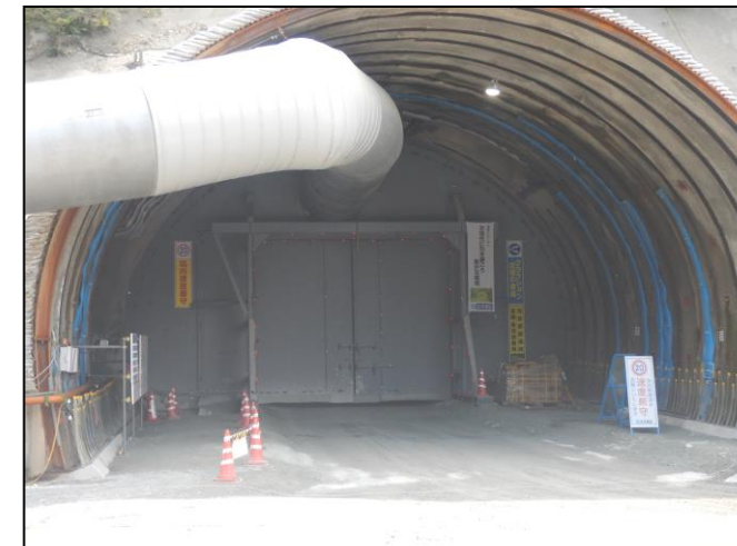
トンネル坑口 防音扉の設置