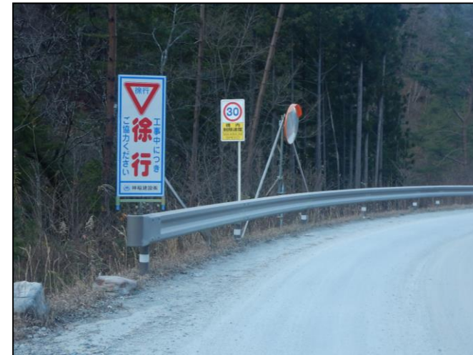
規制速度・走行速度の明示