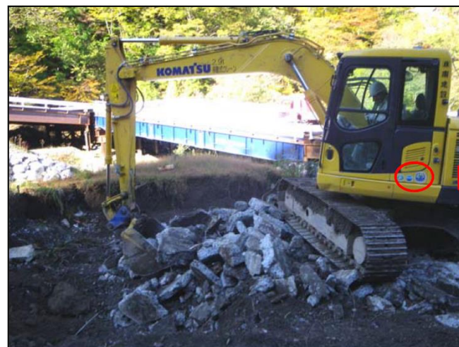
排ガス対策型・低騒音型建設機械