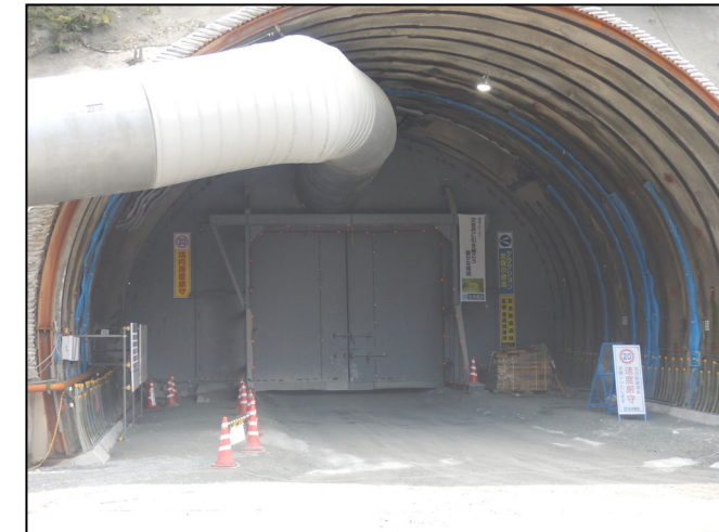
トンネル坑口 防音扉の設置