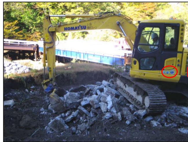
排ガス対策型・低騒音型建設機械