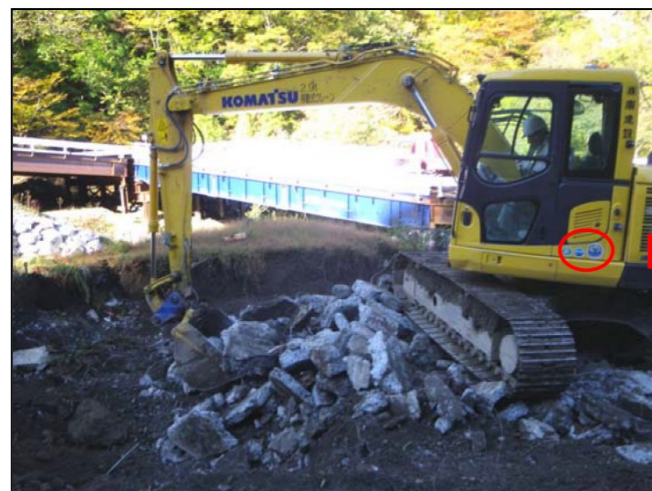
排ガス対策型・低騒音型建設機械