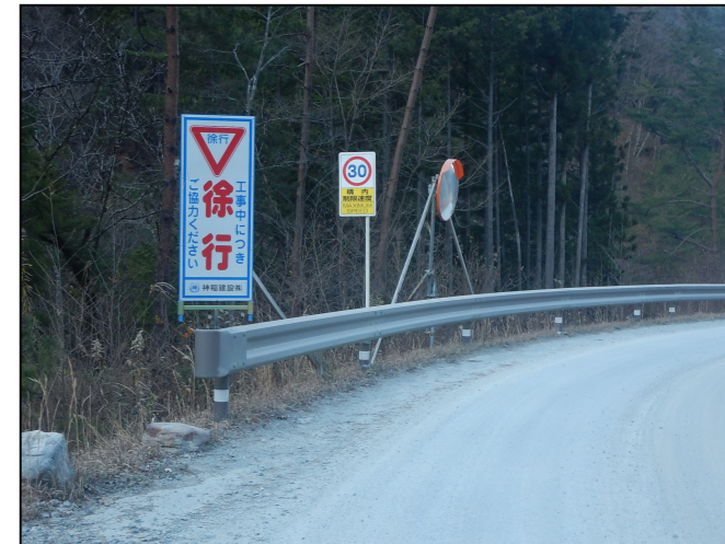
規制速度・走行速度の明示