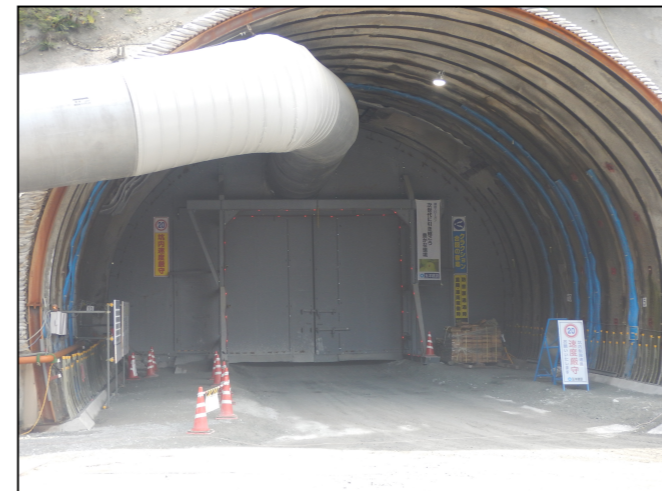
トンネル坑口 防音扉の設置