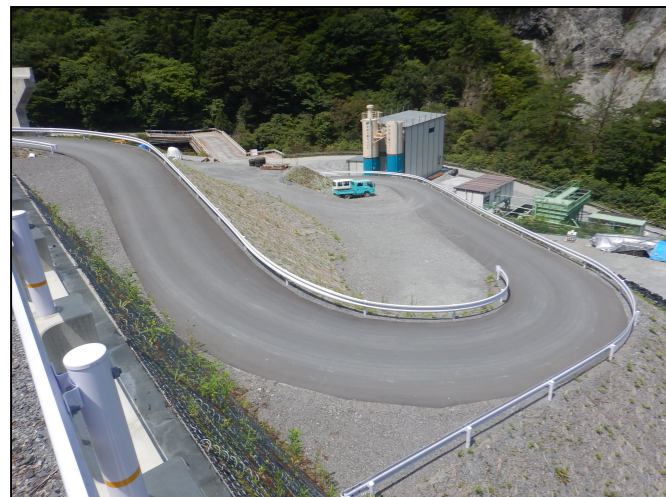
工所用道路の仮舗装