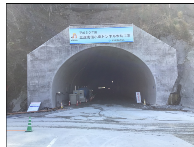
②トンネル本坑坑口