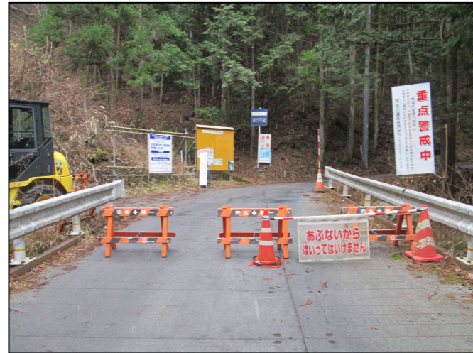
工事現場への立ち入り禁止柵