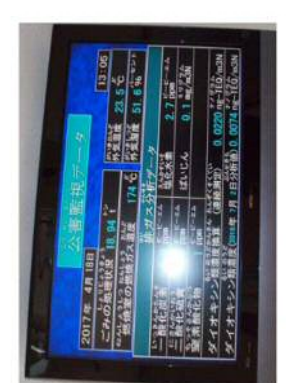
(北都野衛生組合の公害監視データパネル) ふじみ野衛生組合のホームページ (http://fujimino.com/jp/)