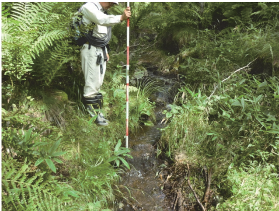
D 湿地下流の河川水（夏季）