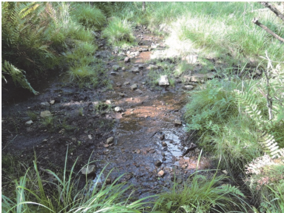
E 湿地下流の河川水（夏季）