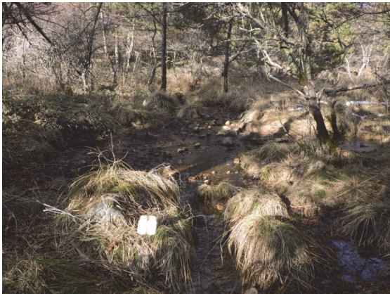
E 湿地下流の河川水（晩秋季）