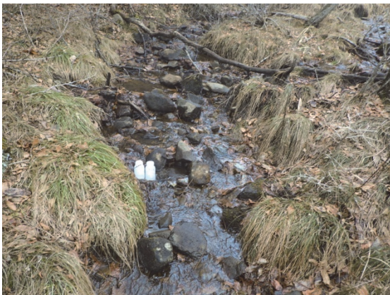
D 湿地下流の河川水（晩秋季）